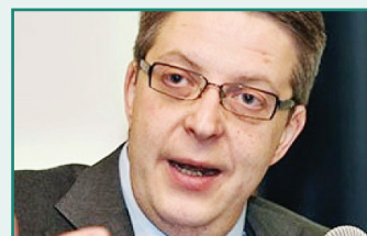
Pirka Tapiolla , Șeful Delegației UE în Republica Moldova

Invocarea considerentelor geopolitice în discutarea Parteneriatului Estic este cu totul artificială. Uniunea Europeană nu încearcă să intre în competiție cu nimeni. Trebuie să rezolvăm o chestiune practică - DCFTA. Transnistria devine din ce în ce mai dependentă de exporturile ei spre piața europeană. Uniunea Europeană este ferm angajată ca de beneficiile DCFTA să se bucure ambele maluri ale râului Nistru.