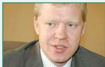
Svante Cornell , Research Director of the Central Asia, Caucasus Institute & Silk Road Studies Programme, SUA

Rusia încearcă să mențină situația din Caucazul de Sud și Europa de Est prin intermediul a două tipuri de politici: a) crearea unui climat în care democrația n-ar putea să se manifeste; b) guvernele trebuie să fie slabe și corupte. În același timp, Rusia pretinde monopolul asupra conflictelor nesoluționate. În continuare, regiunea poate evolua fie în direcția capitulării în fața Moscovei, fie politica neoimperială a Rusiei va eșua, ceea ce se poate produce doar în contextul Integrării Europene. Un exemplu în acest sens ar fi Balcanii de Vest, în care Serbia și Kosovo se mișcă în aceeași direcție.